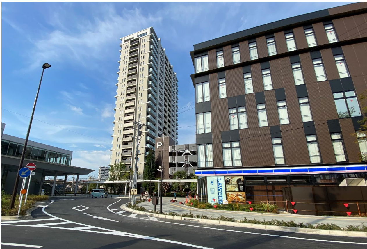
竣工写真（南西より区域全体）

当事業グループ3社は、2017年2月より特定業務代行者として事業参画し、事業協力を行って参りました。