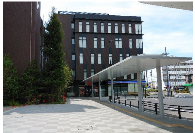
駅前広場から望む住宅棟及び商業・業務棟のエンタランス